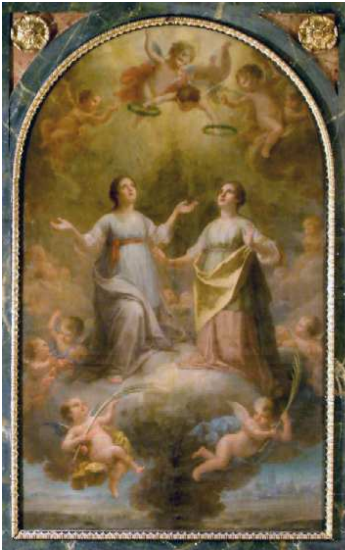
Santas Justa y Rufina