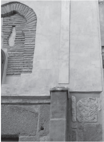
Portada trasera de Santo Domingo el antiguo