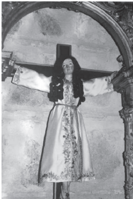
Santa Eulalia de Toledo

Leovigildo envía unos emisarios a Mérida con instrucciones para que Masona abandone el catolicismo y se integre en arrianismo. El Obispo, no solo se niega rotundamente sino que predica en toda la ciudad contra el arrianismo. Leovigildo nombra Obispo de Mérida al arriano Sunna que al llegar a la ciudad reclama para sí la iglesia de Santa Eulalia, se producen enfrentamientos populares y el Rey, en previsión de revueltas internas decide la entrega de la iglesia en un enfrentamiento público, dialéctico y canónico entre Masona y Sunna. De este litigio sale vencedor Masona, e incluso sus adversarios se volvieron aplaudiendo hacia él. Sunna comunicó con mentiras y acusaciones al Rey y este ordenó que Masona fuera traído preso a Toledo. Y en esta ciudad se produce el primer enfrentamiento con el Rey que, al no poder por buenas maneras hacer desistir a Masona de su posición le obligó a que le entregara lo que más hiriera al obispo, la túnica de la mártir y venerada Santa Eulalia para ser depositada en Toledo, en la iglesia arriana de su misma advocación.