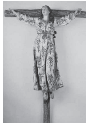
Santa Eulalia 1 , Valladolid Autor Salvador Carmona