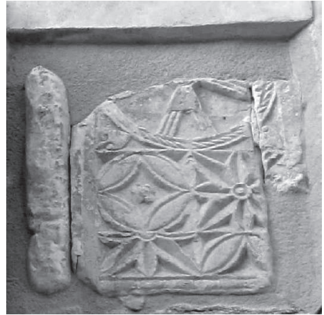
Ampliación del fragmento visigodo

En la actualidad, nada se conserva de aquél monasterio de Santa Eulalia, sin embargo en el anejo convento de Santo Domingo el Antiguo, cuya puerta trasera se encuentra frente a la torre de la iglesia de Santa Eulalia, se han acometido labores de restauración, apareciendo un lujoso relieve de época visigoda, y una ventana más moderna, mudéjar, que junto con otros restos conservados en su interior denotan su antigüedad y origen visigodo, ¿ocuparía la actual fábrica el desaparecido monasterio de Santa Eulalia?, ¿es posible que exista aún bajo su suelo la cripta o nicho donde se depositara el cofre?